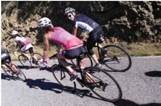
Course de Mont-roig del Camp.

31 Course de la Dinde 26 décembre Course populaire. www.mont-roig.cat