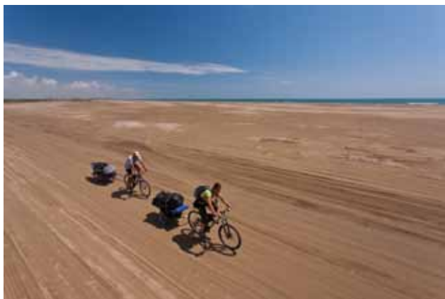
Plage du Trabucador, située au cœur du parc naturel du Delta de l'Èbre.