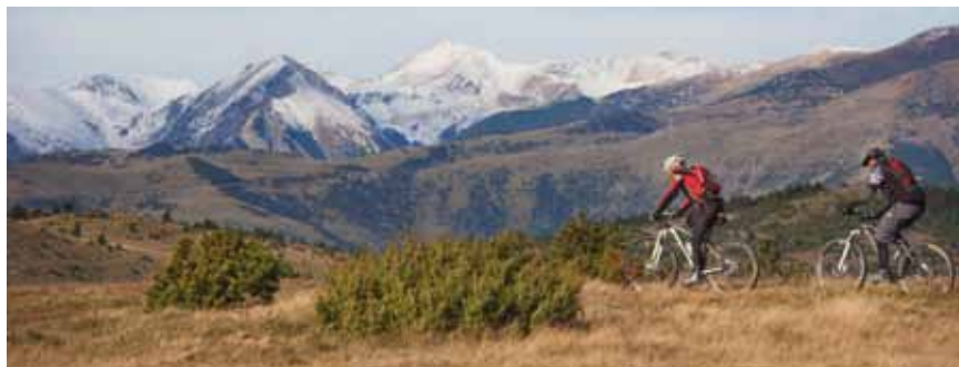
BTT en el Coll d'Ares, Ripollès-Vallespir.

En Girona, la Costa Brava se funde con las montañas de Les Gavarres y el Pirineo a través de atractivas rutas con inicio y final en poblaciones como Calella de Palafrugell, Castell-Platja d'Aro, Sant Feliu de Guíxols, Lloret de Mar o Blanes. Desde la costa del Maresme, con Malgrat de Mar, Santa Susanna y Calella como puntos de partida, un anillo verde une cinco parques naturales de los alrededores de Barcelona, visitando parajes emblemáticos, como el Montseny, el Montnegre o Montserrat. En el sur, el litoral de Tarragona es puerta de entrada a las bucólicas carreteras del Montsant, la Serra de Prades y los Ports de Tortosa-Beseit, desde Cambrils, Mont-roig del Camp, Miami Platja y Sant Carles de la Ràpita.