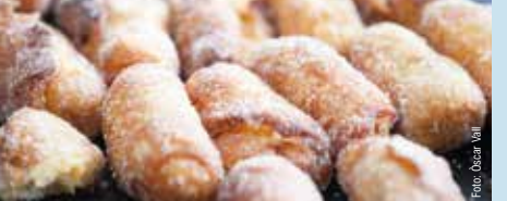
Dolç típic de Girona / Dulce típico de Girona Girona's typical sweet / Doux typique de Girona