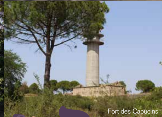
Fort des Capucins