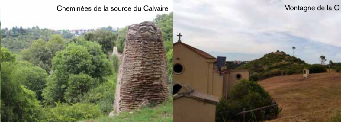
Cheminées de la source du Calvaire