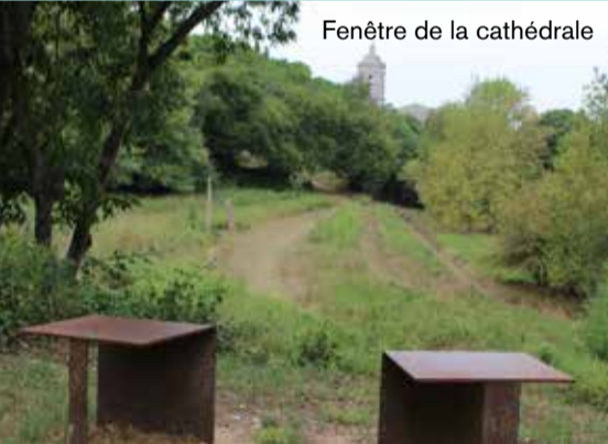
Fenêtre de la cathédrale