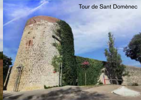
Tour de Sant Domènec