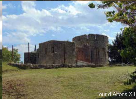
Tour d'Alfons XII