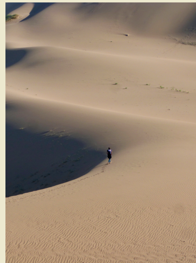
Foto guanyadora Concurs Els camins del teu viatge 2022