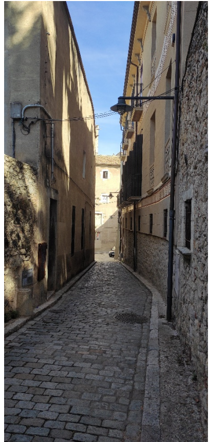
Carrer Portal Nou