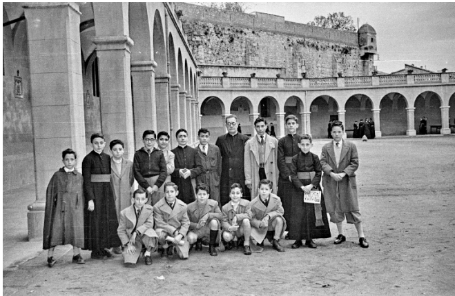
[Pati de la presó. Actualment Seminari Diocesà. A dalt a la dreta. Caseta del Sentinella que vigilava el pati. Foto 1954_CRDI]

Els condemnats que estaven a la nevera, estaven isolats, només sortien a passejar una hora al pati, de dues a tres de la tarda, i per tant era impossible poder tenir cap classe de comunicació amb els altres presos.