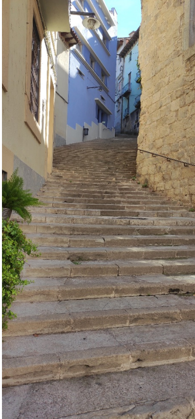
Carrer de la Llebre

El costum dels familiars era pujar pel carrer de la Llebre i els seus cent setanta-tres graons per poder tenir el màxim de temps per contemplar la finestra escollida i que el pres tingués temps per ser avisat pels companys i poder veure els familiars.