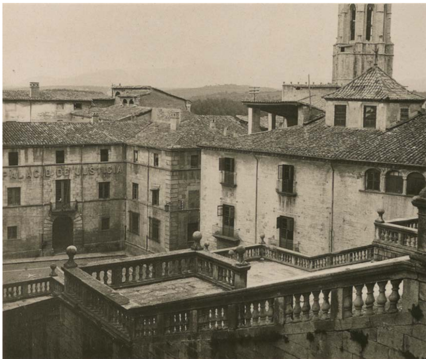
[Palau de Justícia Girona any 1932]