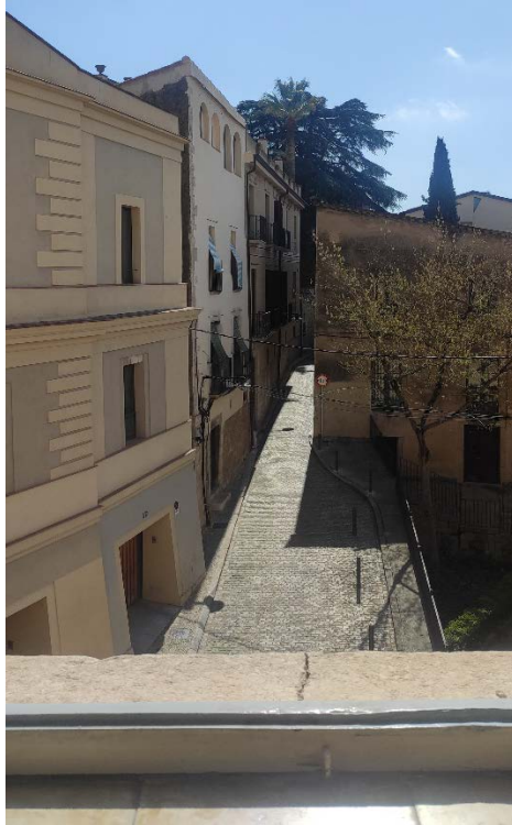
Fotografia des del Seminari de Girona. Just el pis de sobre de la Nevera c. Sentinella

Un altre incident digne de remarcar és el del dia 12. Estava de guàrdia l'artilleria. Passaven dues dones; el sentinella els ordenà que reculassin; l'una reculà; l'altra, representant uns 35 anys ben portats, vestida de negre, continuà caminant, donant explicacions amb naturalitat de paraula. El sentinella se li posà al davant i insistí. La dona s'explicà i intentà continuar caminant passant pel costat del sentinella; aquest l'empenyè brutalment amb la mà sobre el pit; la dona, sense alterar-se continuà intentant caminar. Sorollosa plantofada del soldat a la dona, que continuà volent avançar com si no passés res, malgrat que les mans del soldat l'agafaven i la colpejaven repetidament entre coll i cintura. La dona ja era dos passos més enllà del soldat. Aquest carregà el fusell i quasi l'encara