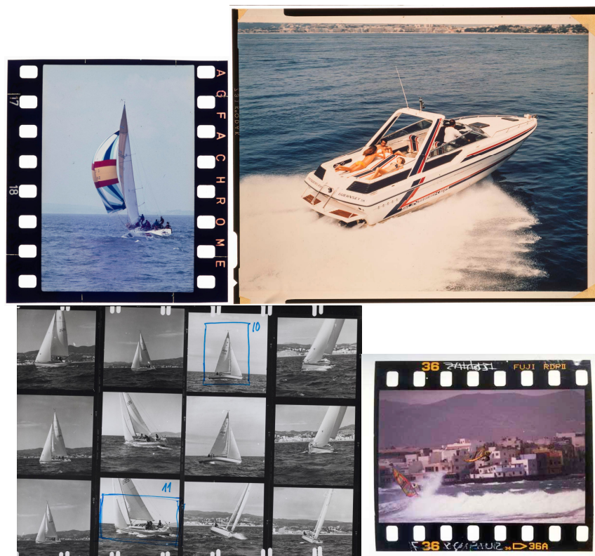
Digitalitzar com a mesura de preservació

En la digitalització dels fons s'han aplicat tècniques de reproducció i control cromàtic i formal d'alta qualitat, controlades i calibrades per complir amb els estàndards de preservació de les imatges digitals. Per evitar manipulacions forçades o situacions potencialment perilloses, s'ha evitat l'ús d'escàners i s'ha optat per la captura a partir d'una càmera digital professional, treballant en columna de reproducció i il·luminació calibrada adient a cada cas -flaix electrònic per a opacs i caixa de llum freda per a negatius i transparències-.