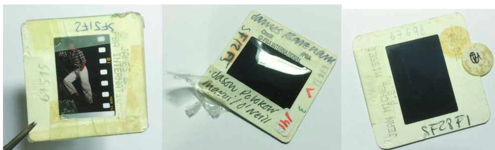
Cintes adhesives sobre els marquets de les diapositives i la mateixa diapositiva

En el cas del fons Surf a vela , les aproximadament quasi 1.400 diapositives en pas universal de revelat cromogen que el formen, han arribat en un estat òptim de conservació, exceptuant alguns casos concrets. Potser el més preocupant d'aquest conjunt, -a part de la degradació i pèrdua progressiva del color inherent a tots els processos cromògens-, són els elements aportats. La pràctica totalitat de les imatges estan en marquets de diapositiva, de cartró o plàstic, i moltes tenen anotacions directes o etiquetes de diverses mides enganxades, amb informacions d'autoria, tema, data..., valiosíssimes per a documentar les imatges, però problemàtiques pel que fa a les degradacions que poden comportar. La descomposició de les masses adhesives ha fet caure etiquetes que s'han acabat dipositant sobre els suports o les emulsions d'algunes diapositives, tacant-les.