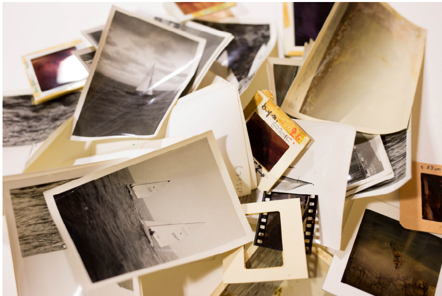
Col·lecció Jordi Maseras.