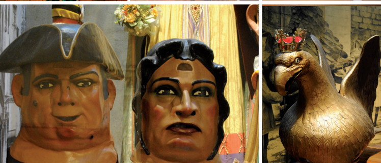
Dipòsit legal: GI.227-2014