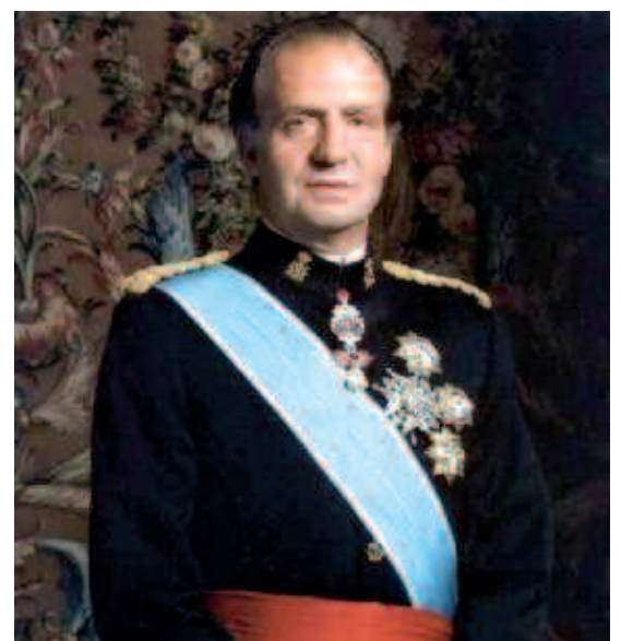
Juan Carlos I