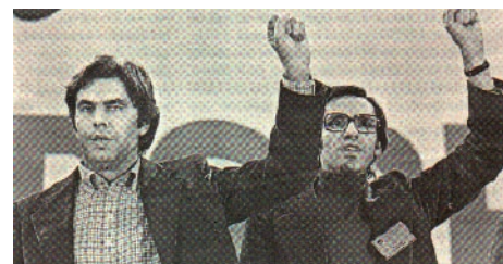
Felipe González y Alfonso Guerra